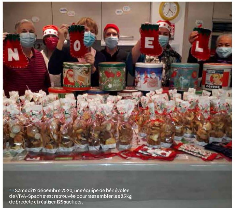
→ Samedi 12 décembre 2020, une équipe de bénévoles de VIVA-Spach s'est retrouvée pour rassembler les 25 kg de bredele et réaliser 125 sachets.

De même, le vin et le jus de pomme chaud sont préparés avec des fruits, des épices et du miel provenant de VRAC. Ils sont faits « maison », avec une recette tenue secrète, mais qui fait ses preuves chaque année. Les membres de VIVA-Spach aimaient se réunir deux à trois week-ends avant le