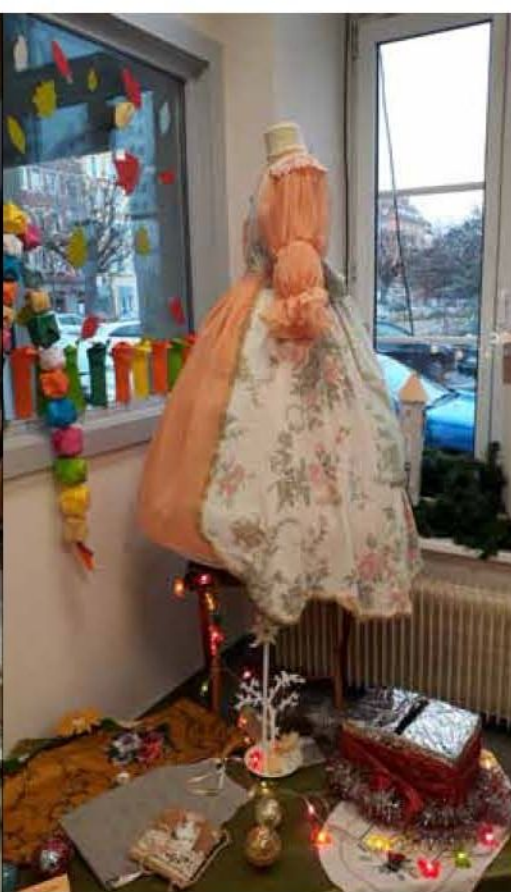
→ Réalisation d'une robe de princesse par Dolorès de l'association BIP pour la tombola du marché de Noël solidaire de La Ruche 35 de décembre 2018