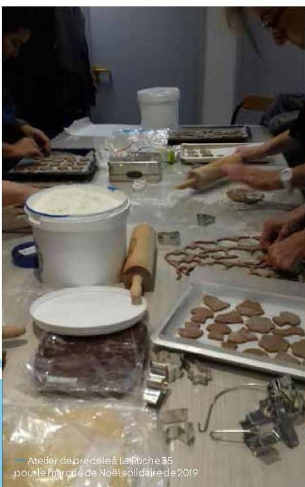
→ Atelier de bredele à La Ruche 35 pour le marché de Noël solidaire de 2019