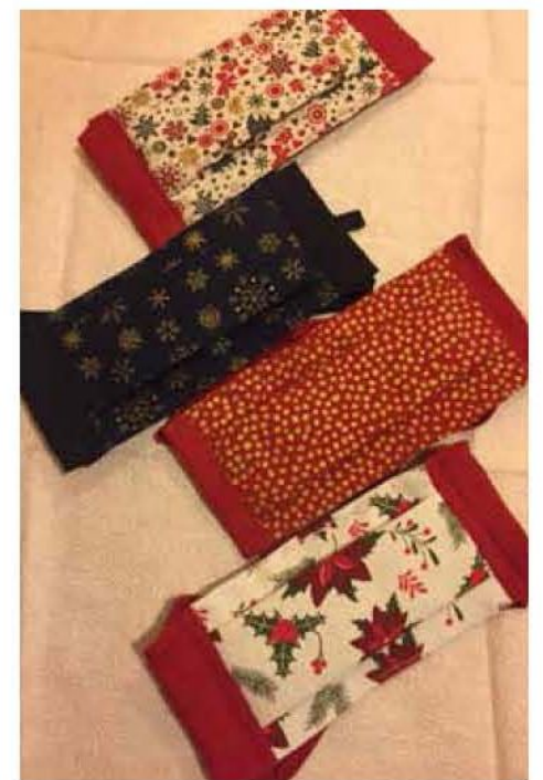
→ Masques en tissu aux motifs de Noël réalisés par Catherine Bauchet, bénévole de VIVA-Spach et ARES